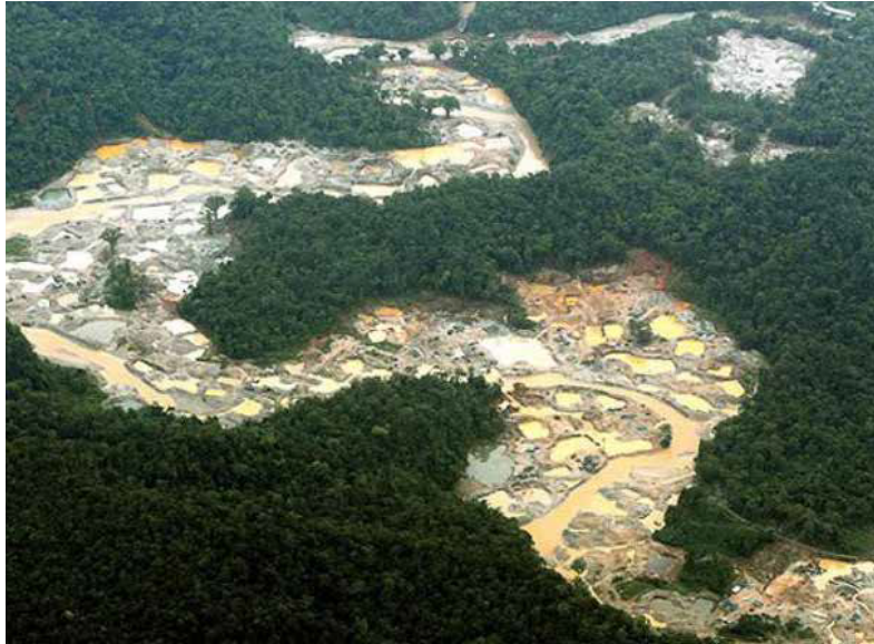
ARCHIVO – E.D.P. AWA

Los ríos hoy son cambiados de sus cursos naturales, se crean embalses inundando tierra fértil donde viven plantas, animales de la montaña y los seres espirituales; perforan la tierra buscando piedras a las que denominaron preciosas para generar supuestamente riqueza, y con ella ambición, guerras, hambre; también buscan hidrocarburos como el petróleo a cualquier costo, contaminando las fuentes de agua, acabando con las vegas, con lo fértil, con nuestra comida. En esta visión del mundo todo se puede vender, todo se puede comprar, todo es extraíble, dañable, negociable, todo se vuelve dinero.