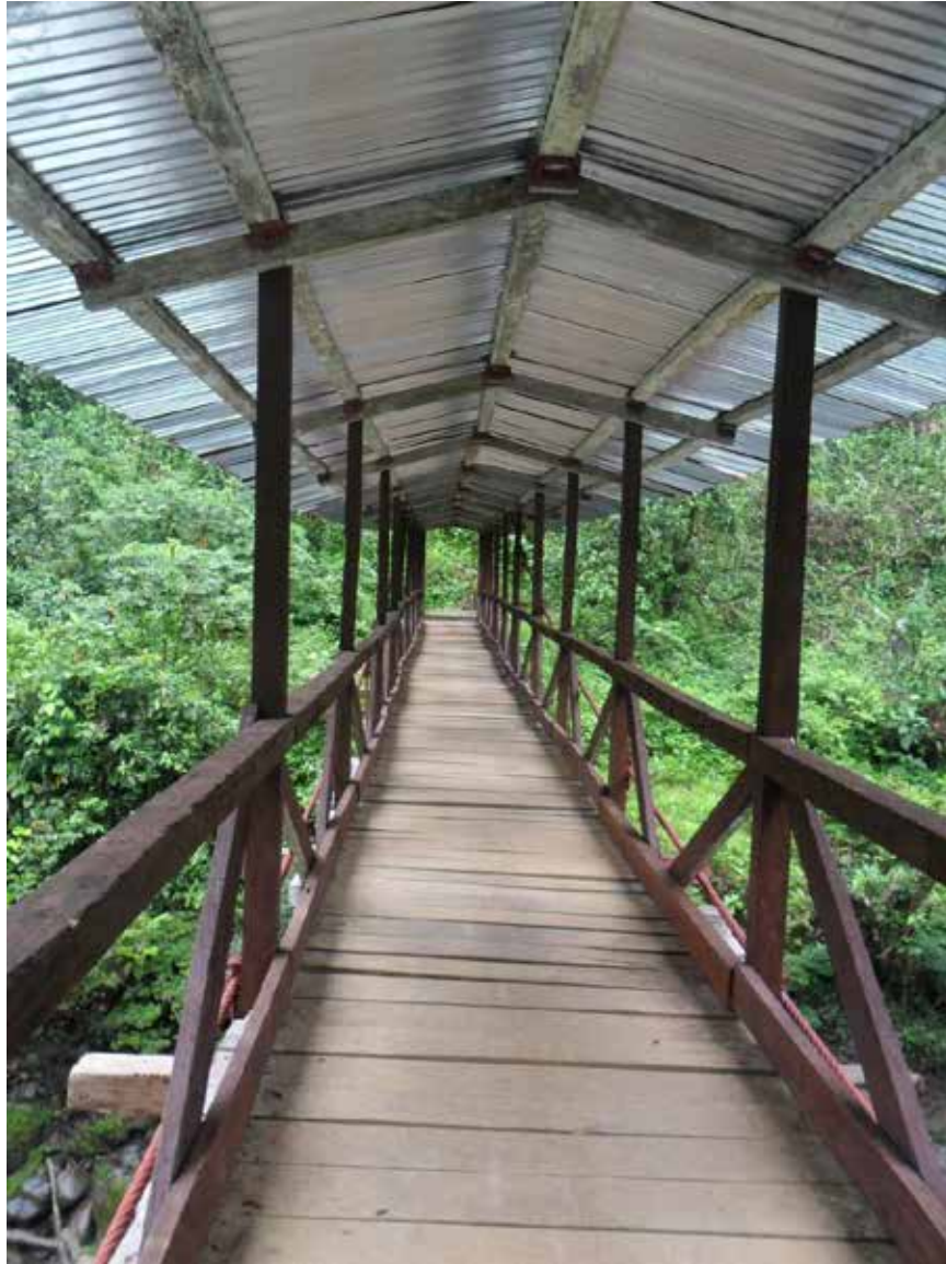
Puente sobre el rio Guiza, Predio El Verde

- . Fortalecer la ritualidad abandonada y dejada de lado por las nuevas generaciones.