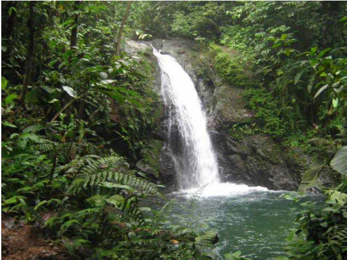
Quebrada La Zoila – Tortugaña Telembí

- Reciclar al interior de los resguardos. Esto es ordenar los procesos de destinación final de residuos sólidos y líquidos a fin de no contaminar nosotros mismos nuestro territorio, nuestra casa grande, partiendo de capacitarnos y replicar esas capacitaciones con todas las comunidades.