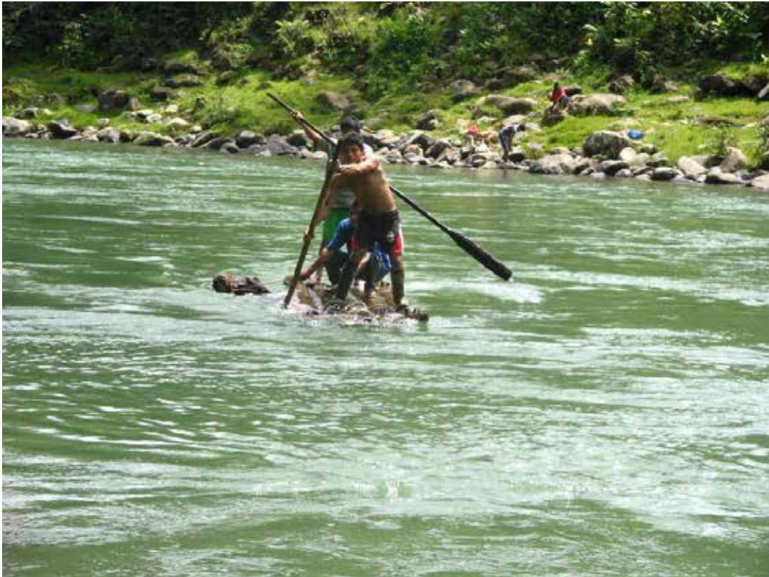
RIO TELEMBI